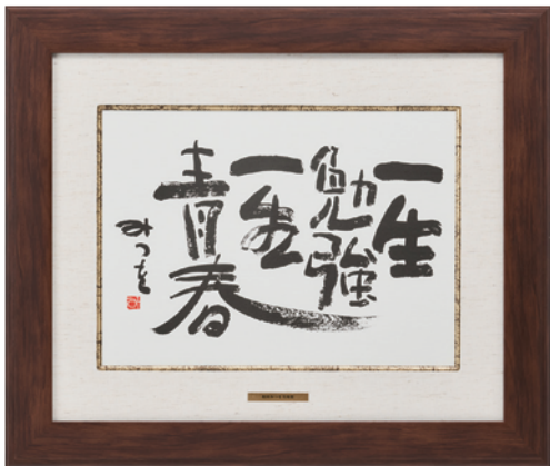
一生勉強 4539404 20824 9