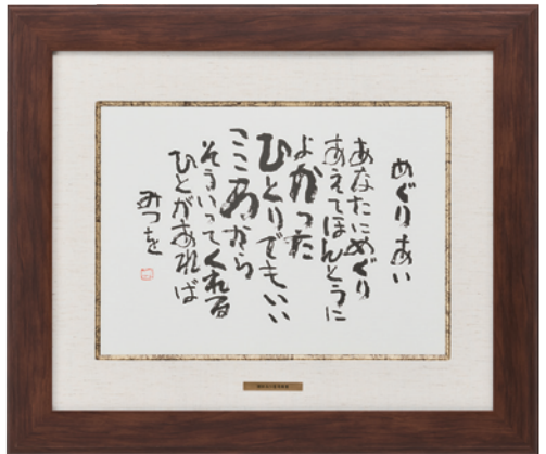
めぐりあい 4539404 20823 2