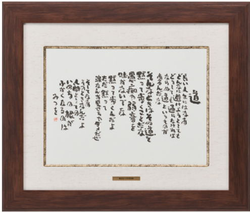
道 4539404 20822 5