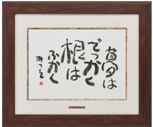
夢はでっかく 4539404 20821 8