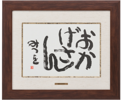
おかげさん 4539404 20820 1